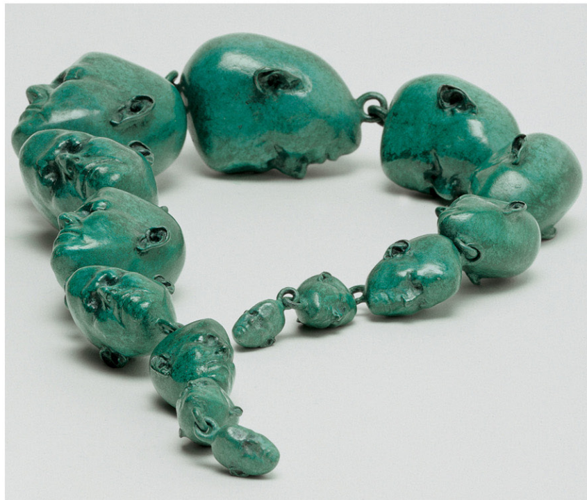
'Worry beads', een bronznen keten van hoofden.